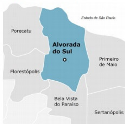
LIMITES DO MUNICÍPIO